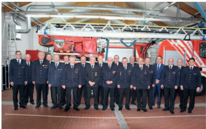
Geehrte Mitglieder für 40 Jahre Zugehörigkeit

Wir freuen uns sehr, dass wir so engagierte Feuerwehrmitglieder haben, die sich mit Herzblut in allen Notlagen für unsere Einwohnerinnen und Einwohner einsetzen. Vielen Dank für die Übernahme dieses risikoreichen und herausfordernden Ehrenamts zum Wohle Aller – Gott zur Ehr', dem Nächsten zur Wehr!