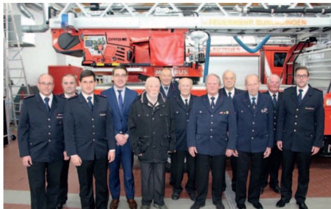
Geehrte Mitglieder für 50 und 60 Jahre Zugehörigkeit