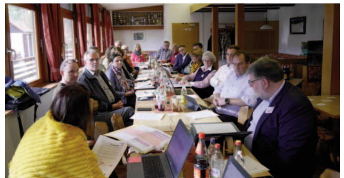
Mitglieder des LEADER-Beirats diskutieren im Rasthaus der Sontheimer-Höhle in Heroldstatt über die Vergabe von Fördermitteln an Antragsteller von Kleinprojekten.

Der Förderverein Gauselfingen errichtet einen Dirtpark/Pumptrack , auf dem Jugendliche und Erwachsene ihr Hobby Fahrradfahren/Mountainbiken ausüben können. Es wird ein Parcours mit verschiedenen Hügeln, Kurven und Schanzen entstehen. Der Pumptrack dient als Treffpunkt insbesondere für Jugendliche, an dem das Einschätzen der Geschicklichkeit und das Ausloten der eigenen Grenzen in einem sicheren Umfeld erlebt werden kann. Weitere Informationen zum Förderprogramm Regionalbudget unter www.leader-alb.de .