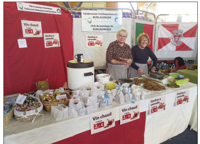
Die beiden Waffelbäckerinnen in vollem Einsatz

Die An- und Abreise gestaltete sich problemlos und – zumindest auf französischer Seite – ohne Staus. Einhellige Meinung aller fünf Delegationsmitglieder am Ende des Marktes: nächstes Jahr wieder!