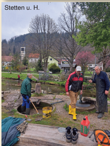
Stetten u. H.